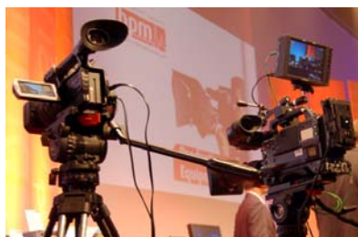
Moderne Kameratechnik, die im Broadcast Service Center gewartet und repariert wird

Es ist eine sehr anspruchsvolle Ausbildung, bei der ein guter Überblick vermittelt wird, wie Fernsehen funktioniert. Der Auszubildende lernt, welche Technik beim Mitteldeutschen Rundfunk eingesetzt wird und wie ein Magnetbandaufzeichnungsgerät (MAZ), ein Monitor und eine Kamera funktioniert. Außerdem lernt er Kundenaufträge abzuwickeln, einen Kostenvoranschlag zu erstellen und Ersatzteile zu beschaffen.