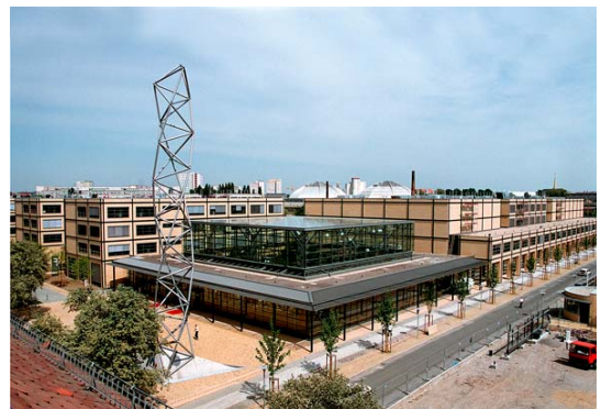
Firmensitz in der media city leipzig